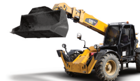
Manipulátor CAT TH 414