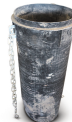
Stavební shoz základní díl