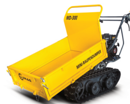
Minidumper Lumag MD 300