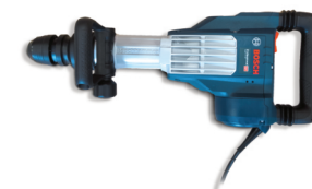
Bourací kladivo Bosch GSH11 VC