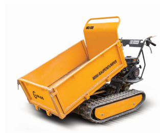
Minidumper Lumag MD 500