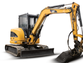
Pásové rypadlo CAT 304