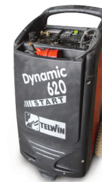
Nabíjecí zdroj se startem Telwin Dynamic 620