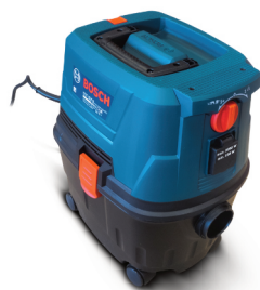
Vysavač Bosch GAS 15 PS