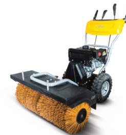
Motorový smeták s pojezdem Stiga | šířka 800 mm