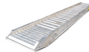
Hliníkové nájezdy nosnost 7 500 kg