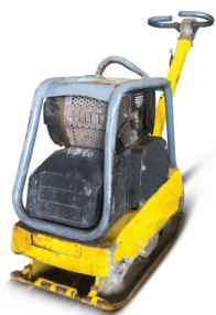
Reverzní vibrační deska Wacker Neuson