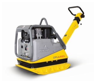
Reverzní vibrační deska Wacker Neuson DPU 6555