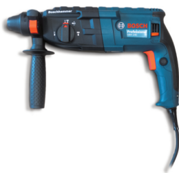
Příklepová vrtačka Bosch GBH 240