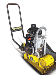
Vibrační deska Wacker Neuson VP 1030