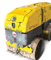
Vibrační příkopový válec Wacker Neuson RT82-SC2