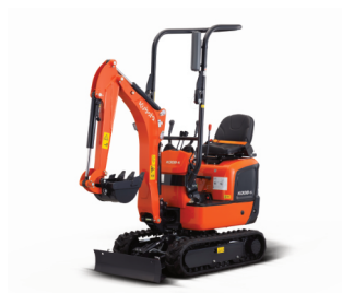
Pásové minirypadlo Kubota K008-3