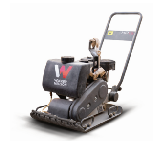
Vibrační deska Wacker Neuson MP 15