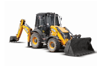
Traktorbagr JCB 3 CX