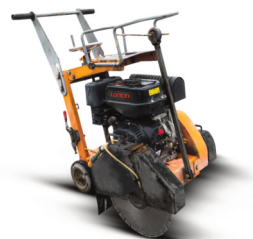
Spárová řezačka 9,7 kW | hloubka řezu 160 mm