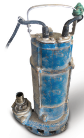
Ponorné čerpadlo kalové