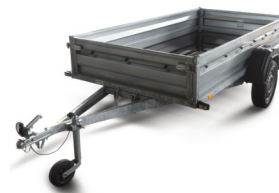
Rozbušovací pila na beton TS 360