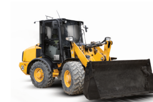
Kloubový nakladač CAT 906