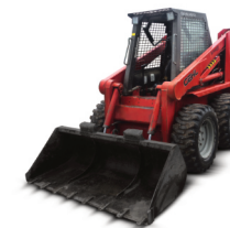
Smykový nakladač Gehl 4625